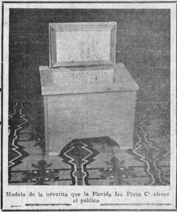
Modelo de la neverita que la Florida Ice Farm Co ofrece al público

Estas NEVERITAS las ofrece la Compañía al público que por falta de Nevera carece de los importantes servicios de refrigeración en su casa, al módico precio de $ 24.00 pagaderos en 12 meses