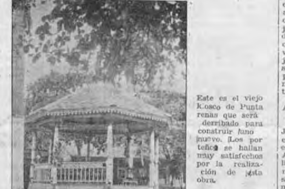
Este es el viejo kiosco de Puntarenas que será derribado para construir uno nuevo.