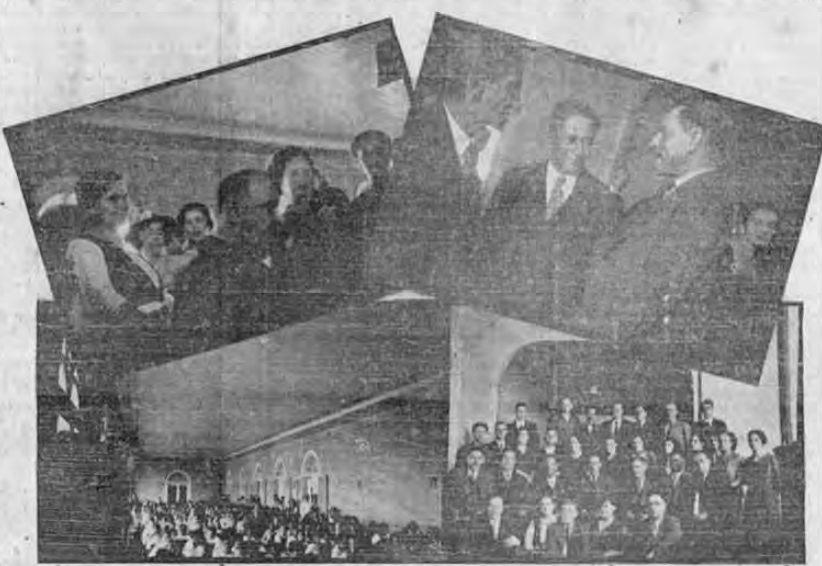
Recoge la composición algunos aspectos del acto conmemorativo efectuado ayer en el Instituto de Alajuela y al que concurrieron el Sr. secretario de educación y distinguidas personalidades de la enseñanza nacional. En otra sección publicamos la correspondiente crónica.

Director: JOSE MARIA PINAUD Domingo 19 de Mayo de 1935 Año XVI Número 4370