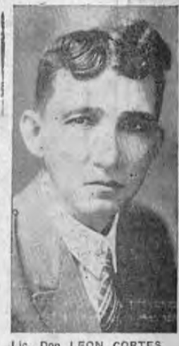
Lic. Don LEON CORTÉS

El jefe y candidato del Partido Republicano Nacional, Lic. don León Cortés, ha recibido valiosas adhesiones de importantes elementos del Clero Costarricense. Curas párrocos de diversas localidades del país le han hecho su adhesión a la vez que algunos le han escrito sobre el particular. Ayer el licenciado Cortés recibió una carta de uno de esos señores sacerdotes y ayer mismo contestó los conceptos de la misma. En esa contestación el licenciado Cortés expone importantes puntos de vista. Nosotros logramos enterarnos de algunos de los principales conceptos que son los siguientes: —Muchas muestras de simpatía recibo diariamente de diferentes partes del país que van poniendo en mi ánimo un sentimiento de confianza y gratitud. La adhesión de usted me llena de gran regocijo. Mucho la agradezco. Al confesar el respeto profundo que me merece la Iglesia, no lo hago por el deseo de atraer voluntades sino como la expresión sincera de mi convicción más íntima, puesta a prueba en el servicio de las posiciones públicas que me ha tocado desempeñar. La iglesia es una fuerza moral de primer orden y ningún gobernante puede dejarse de considerarla como colaboradora indispensable en la obra social del gobierno. Como decimos, estos son conceptos de la carta que el licenciado Cortés dirigió al contestar la adhesión de que hacemos referencia, y por la importancia de los mismos ofrecemos a los lectores.