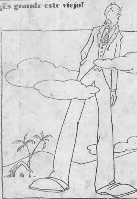
— ¡Da gusto para delirio hasta "los resentidos" se van a hacer güechos de tanto admirarlo y periquearlo! — Este documento es propiedad de la Biblioteca Nacional "Miguel Obregón Lizano" del Sistema Nacional de Bibliotecas del Ministerio de Cultura y Juventud, Costa Rica.

CIUDAD DEL VATICANO, 18.— Once cardenales concurrieron a los servicios ofrecidos en sufragio del alma del mariscal Pilsudski, el hoy aquí.