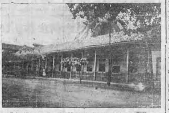
Esta foto muestra el edificio escolar de Puntarenas cuya reconstrucción se ha ordenado.—Con estos trabajos en este edificio Puntarenas dispondrá de planteles oficiales de buena construcción.

de opiniones al respecto y en ellas hemos podido constatar que los lectores de este rotativo, manifiestan su satisfacción declarando que este es un notable triunfo que se anota LA TRIBUNA como periódico de lectura selecta y seria.