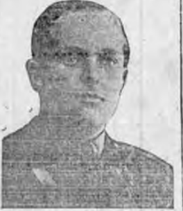
EX-PRINCIPE DE ASTURIAS

PARTIRA EL JUEVES PARA NUEVA YORK, EN DONDE SE REUNIRA CON SU ESPOSA